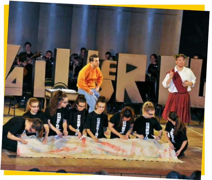
▲ 俄罗斯和奥地利音乐年。