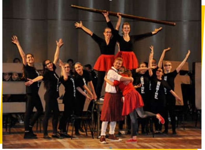
▲ 莫扎特“魔术长笛”演剧场面（歌剧训练系）。