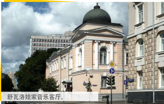
舒瓦洛娃家音乐客厅。