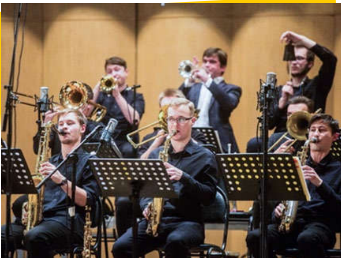
▲ “Academic Band” 爵士乐队。