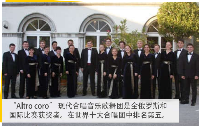
“Altro coro”现代合唱音乐歌舞团是全俄罗斯和国际比赛获奖者。在世界十大合唱团中排名第五。