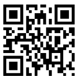
俄罗斯格涅辛音乐 学院网址