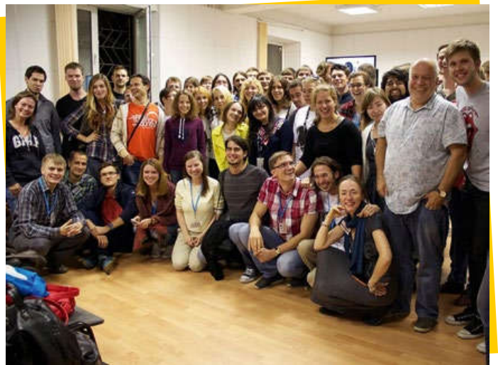
▲ Gnesin contemporary music week当代音乐节实验室。