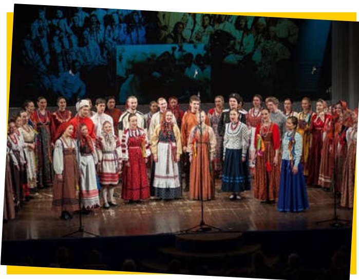
▲ 俄罗斯格涅辛音乐学院日班民间合唱团。

在两个国际平台Erasmus+和意大利大使馆青年人才支持项目基础上、学院的歌剧工作室准备了并同两个意大利音乐学院：意大利帕尔马市阿尔里戈·博伊托 (Arrigo Boito) 音乐学院和佛罗伦斯市马吉奥·穆济卡 (Maggio Musicale) 歌剧歌手学院、组织了朱塞佩·威尔第“茶花女”歌剧。